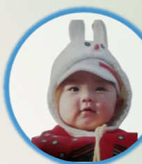
우라미 박사 2년차