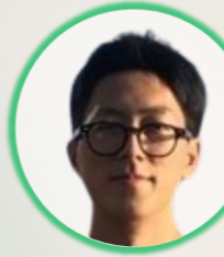
공민 석사 1년차